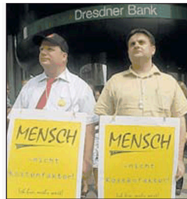
Mitarbeiter der Dresdner Bank sind sogar schon – untypisch für Banker – auf die Straße gegangen