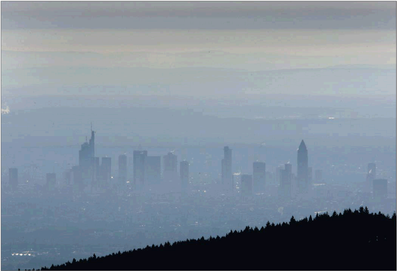
Bankenviertel im Dunst: Viele Mitarbeiter der Geldhäuser in Frankfurt bangen und suchen neue Jobs.